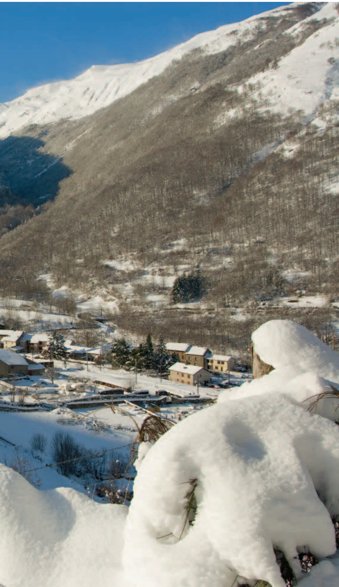
Le village de Mérens-les-Vals.