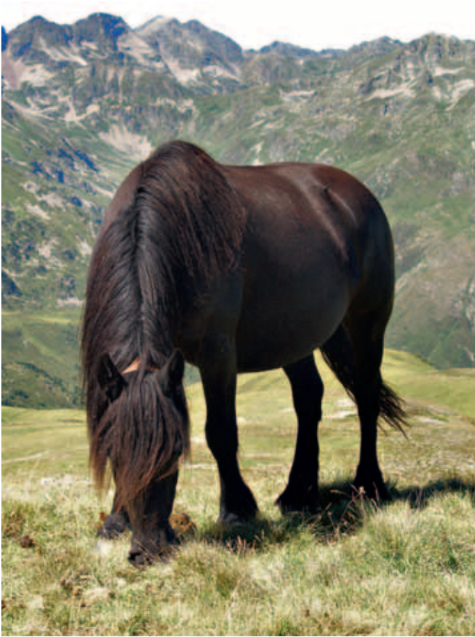
Paquita des Gesquis.

Même sommairement relatée, l'histoire de Bonbon est trop belle pour que la main d'un artiste, ou à défaut celle du temps, n'y brode pas un jour des rajouts plus beaux encore. Décidément, le cheval de Mérens n'est pas près d'en finir avec sa légende.