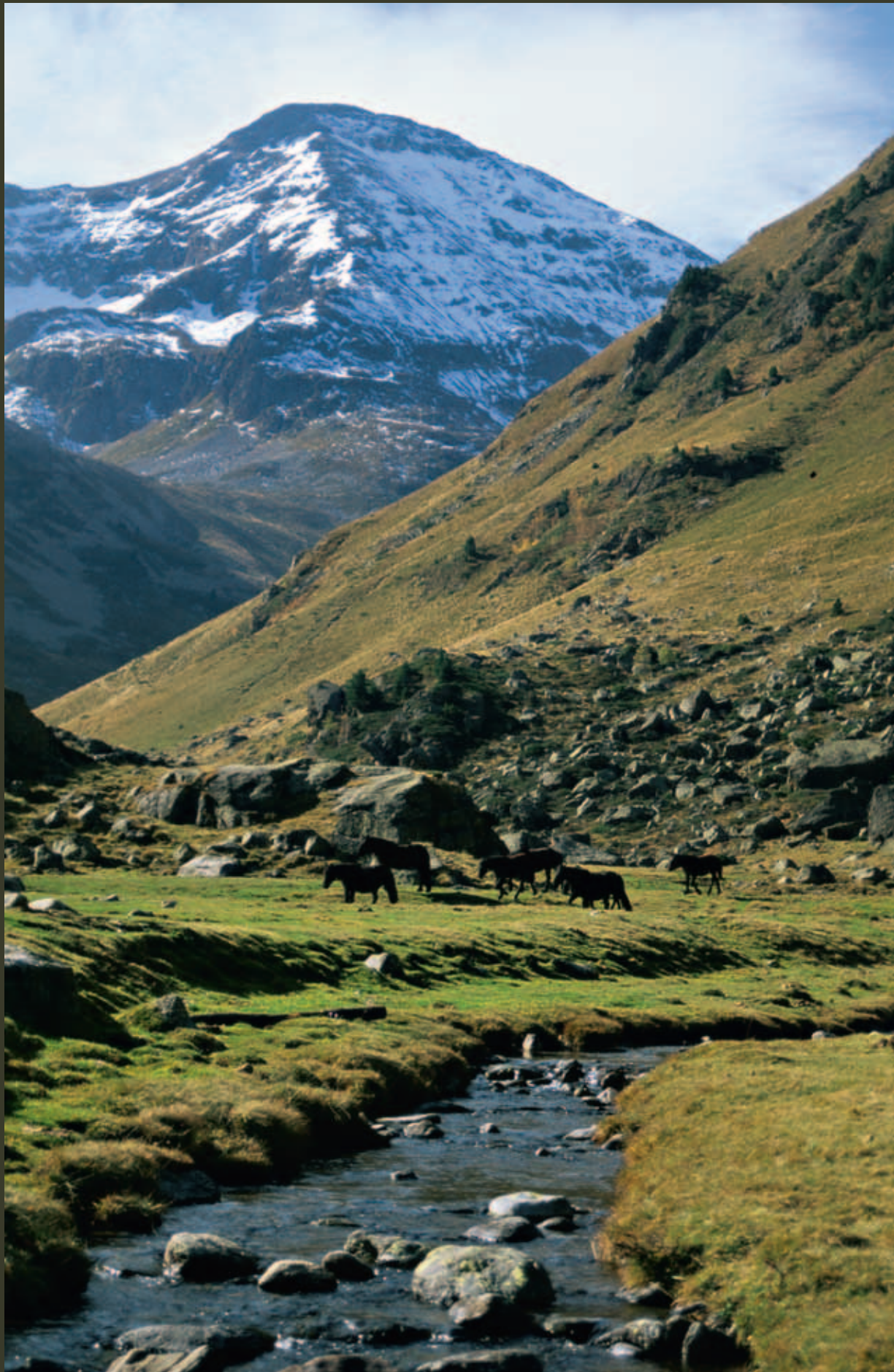
Estive en vallée d'Aston.