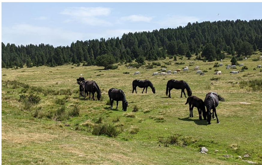
Een kudde Mérens op Plateau de Beille

8. Eclair d'Heins, geboren 21 april 2014 V: Timbol du Bosquet, M: Tanis d'Heins Fokker: de heer J.P. Doumens