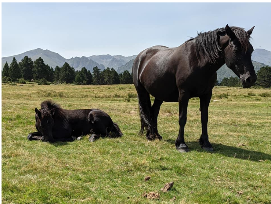
Merrie met veulen op Plateau de Beille